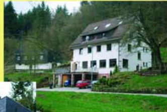
Die beiden Häuser