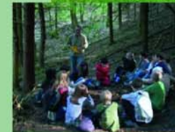
Landheim des Helmholtz-Gymnasiums Heidelberg

Im Herzen des UNESCO-Geoparks Bergstraße-Odenwald und des Naturparks Neckartal-Odenwald